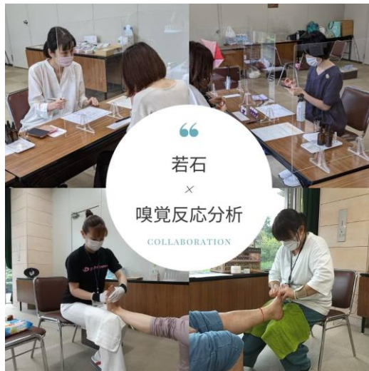
▲ 広い場所でソーシャル ディスタンスも考慮して