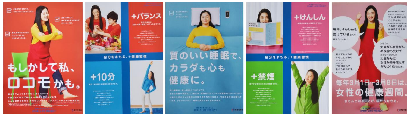
① ロコモ ② バランス ③ 睡眠 ④ 検診&禁煙 ⑤ 女性の健康

「健康寿命を延ばしましょう」というスローガンのもと、厚生労働省の呼びかける国民運動であるスマートライフプロジェクトからポスターの配給がありました。つきましては、希望者に差し上げます。お一人様につき1枚限定です。ご希望の方は、FAX又はメールで、ご希望のポスター番号をお伝えください。数に限りがありますので、先着順です。在庫切れの際はご容赦ください。